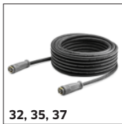
32, 35, 37