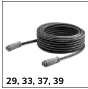
29, 33, 37, 39