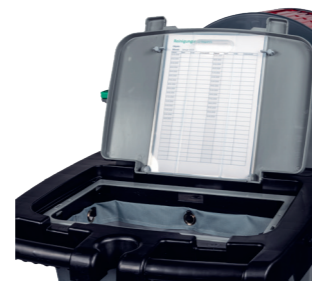
Praktische Auf- und Ablage für Reinigungspläne.