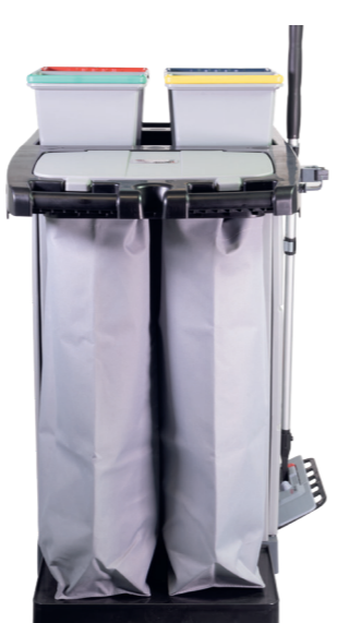
Optionaler Wäschesack klein. Art.-Nr. 304025