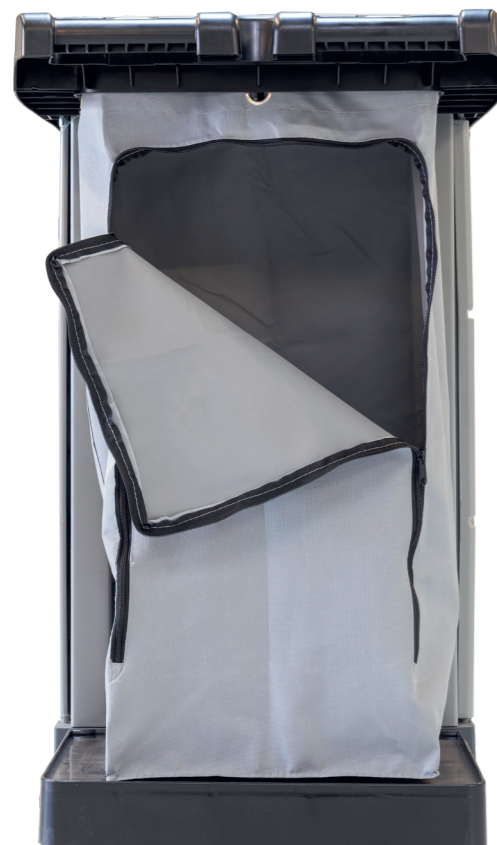
Wäsche oder Müll durch Reißverschluss leicht zu entnehmen.