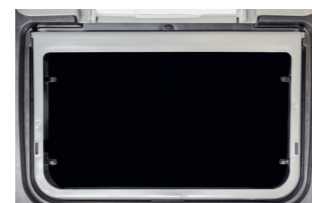
120 Liter Fassungsvermögen.