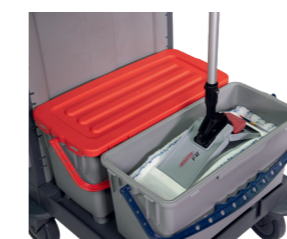
Hygienisch: Berührungsfreie Aufnahme durch optionalen V-Wing Klapphalter (S. 116).