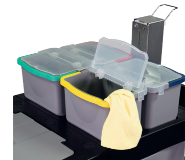
6 Liter Eimer mit transparentem Deckel.