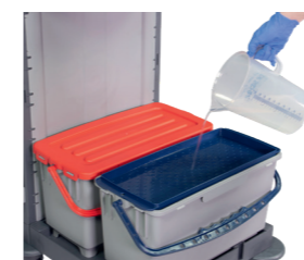
Optionale Tränkhilfe. Art.-Nr. 305032 blau & 305033 rot