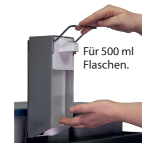
Für 500 ml Flaschen.