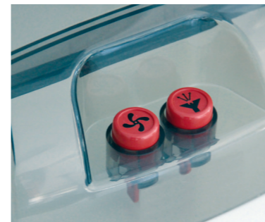
Sprüh- und Saugfunktion sind einzeln am Gerät zuschaltbar.