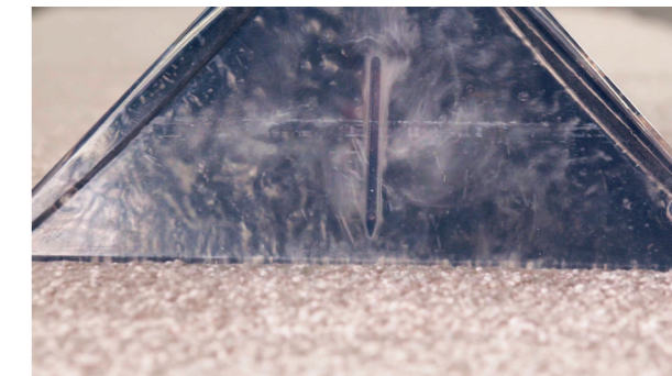
Anschließendes Aufsaugen des Schmutzes, inkl. Flüssigkeit.

Glasklare Polster-Sprühdüse zur Reinigung von Polstermöbeln oder Fahrzeugsitzen. Ergonomischer Handgriff mit handlichen, bequemen Bedienelementen. Die Sprühfunktion ist per Bedienelement am Handgriff dosierbar.