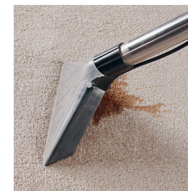
Glasklare Bodendüse mit langem Saugrohr zur bequemen, ermüdungsfreien Teppichreinigung.