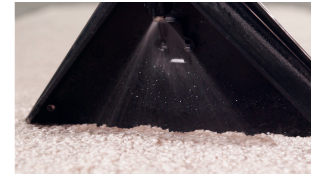
Reinigungsmittel wird bei Bedarf aufgesprüht.