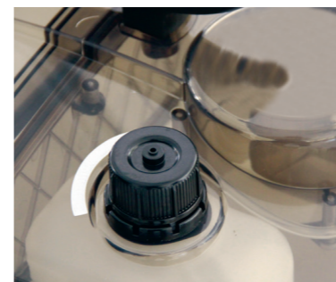
Ein separater Tank ermöglicht den Betrieb mit Entschäumer und garantiert damit ein kontinuierliches Arbeiten.